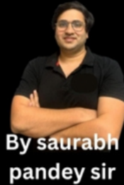
By saurabh pandey sir

Also include ARC Report on ethics in Governance